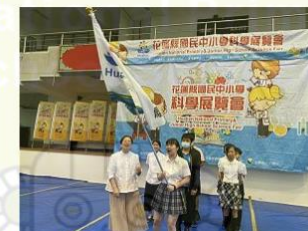
近百隊伍科展競技 6作品脫穎而出代表花蓮出征全國