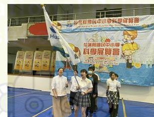
近百隊伍科展競技 6作品脫穎而出代表花蓮出征全國