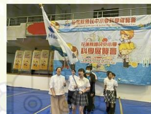
近百隊伍科展競技 6作品脫穎而出代表花蓮出征全國