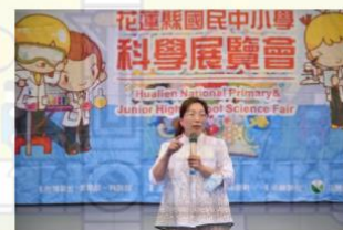
科展頒獎暨授旗 徐榛蔚：用教育留住花蓮未來人口紅利！