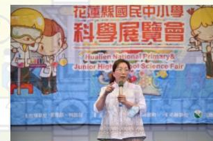
科展頒獎暨授旗 徐榛蔚：用教育留住花蓮未來人口紅利！