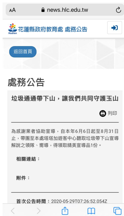
圖：連結到該公告網頁