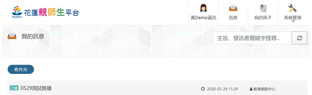
圖：親師生平台接收公告推播訊息

當訂閱單位發布新公告並選擇推播時，使用者可於親師生平台的訊息模組中查看到推播的訊息。