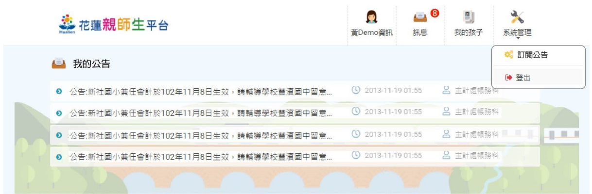
圖：親師生平台訂閱公告