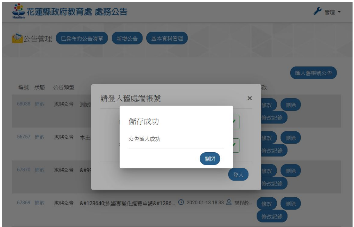
圖：成功匯入公告提醒