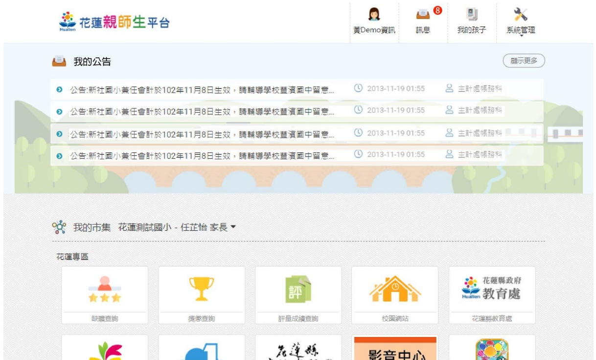
圖：親師生平台查看我的公告

花蓮親師生平台的登入使用者可查看我的公告，我的公告範圍為使用者訂閱的單位所發布之公告，並按照最後修改時間排序。點選顯示更多公告，則外開到處務公告之我的公告頁面。