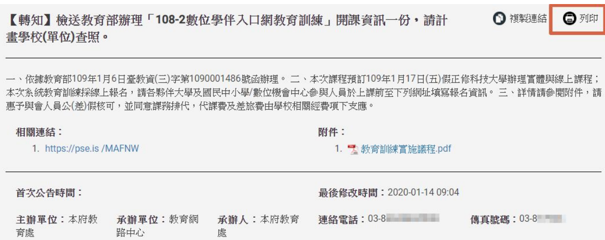
圖：公告列印功能位置