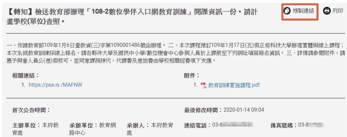
圖：複製連結功能位置