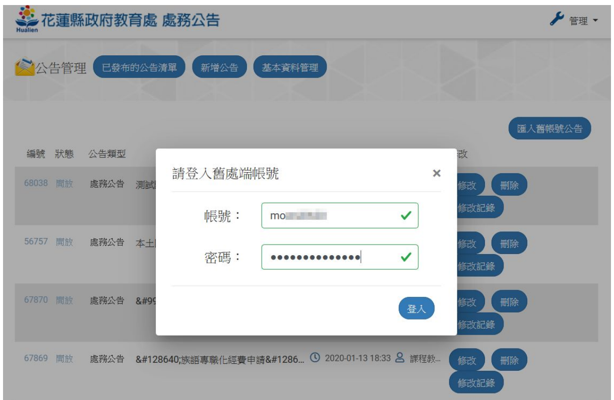
圖：輸入舊帳號、密碼畫面

※ 學校使用者之舊公告屬於學校(不屬個人)故學校管理者、學校承辦人登入後，皆可編修舊公告；但新公告屬個人，故必須使用個人帳號登入後做編修。