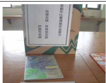
圖書館展演活動小書創作比賽 作品展