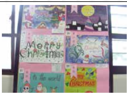
聖誕創意比賽海報