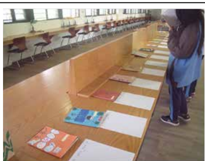
圖書館展演活動小書創作比賽 作品展