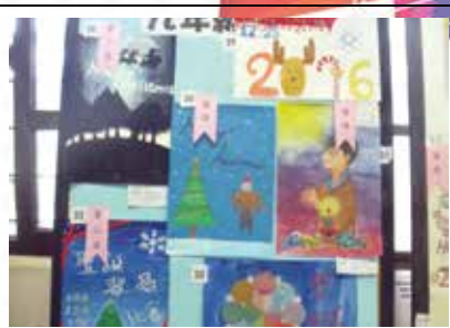
聖誕創意比賽海報