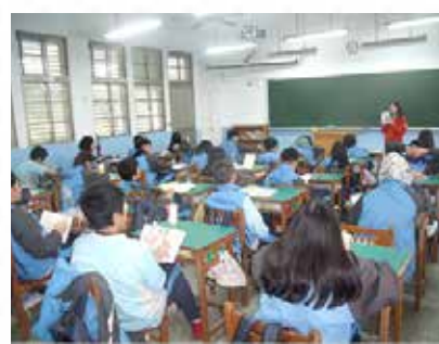
圖推教師入班好書導讀