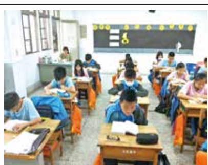
新生閱讀推廣 - 一人一本好書