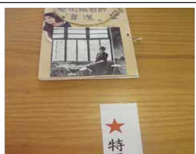
小書創作特優作品