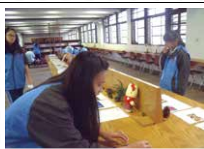
校內學生參與聖誕特展