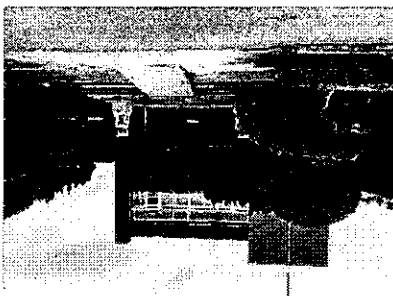
視聽教室所在位置入口