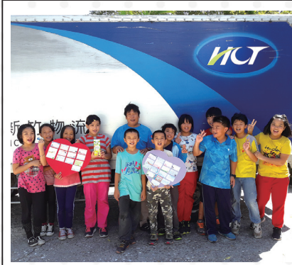
借閱愛的書庫書籍，感謝藍色超人