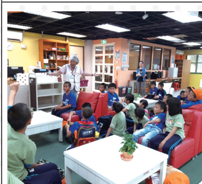
參觀花蓮文化局圖書館