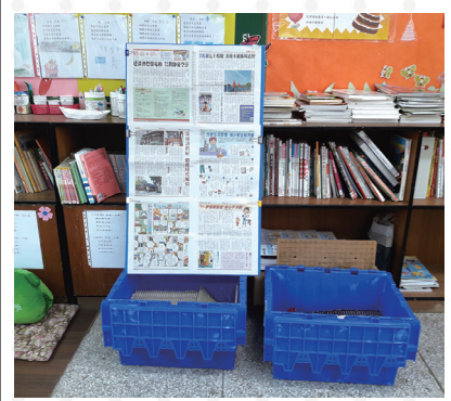
愛的書庫班級共讀