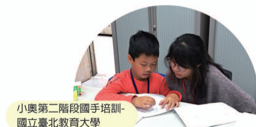
小奧第二階段國手培訓- 國立臺北教育大學