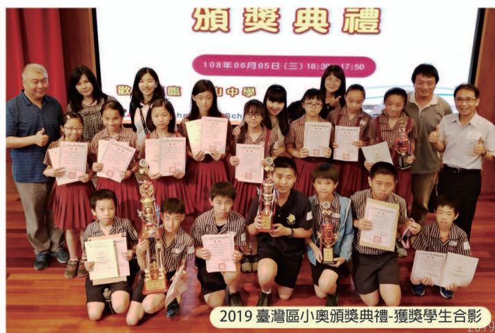
2019 臺灣區小奧頒獎典禮-獲獎學生合影