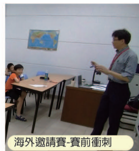
海外邀請賽-賽前衝刺