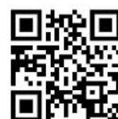
台北海洋科大賽場