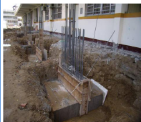
施工中(預設為「鋼筋綁紮」階段)