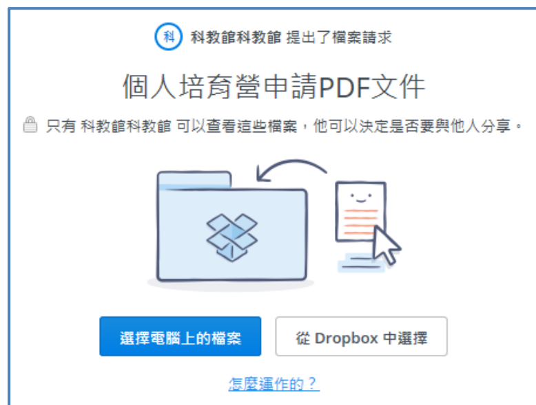
個人培育計畫申請 PDF 文件上傳示意圖