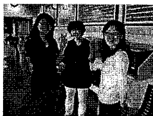
參加英語師資培訓的老師