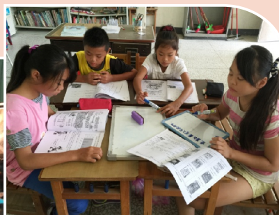
閱讀理解策略教學