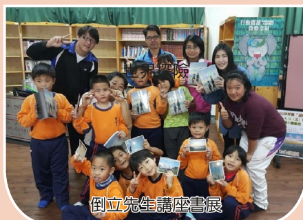
倒立先生講座書展