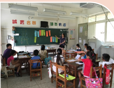
自我提問技巧訓練