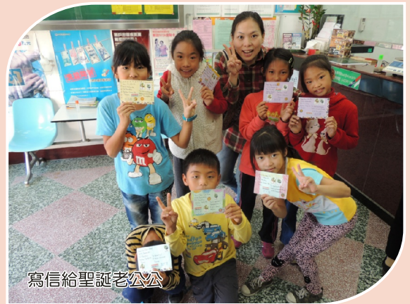
寫信給聖誕老公公