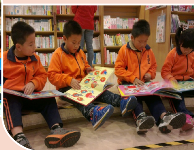
誠品書局閱讀活動