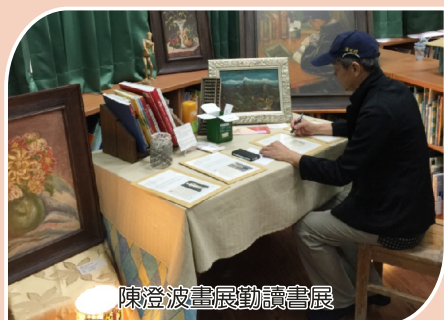
陳澄波畫展勤讀書展