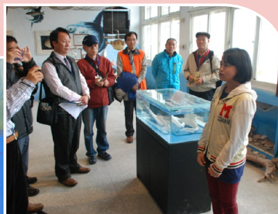
高年級小朋友透過一連串的课程訓練，終於可以上場為外賓進行海洋生態的導覽與解說。