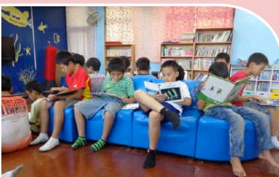
圖書館採光良好，木質地板規畫出舒適的閱讀環境，是康樂國小的孩子最愛去的地方，愛看書的孩子看起來特別有氣質。