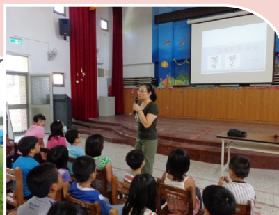
淑惠老師透過故事「馬的紀律與服從」讓學生了解服從就是能積極的執行尊長交代的事物，並能不抱怨的完成分內的工作。