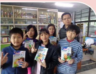
校長致贈小朋友書籍，鼓勵小朋友多多從事閱讀活動。