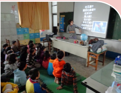
校長在本校三年級和五年級說故事之情景