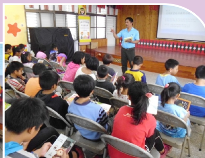
圖書教師介紹書籍