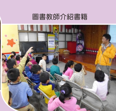
圖書教師介紹書籍