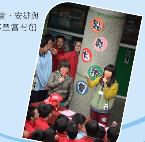
學習記錄手冊-點數大拍賣