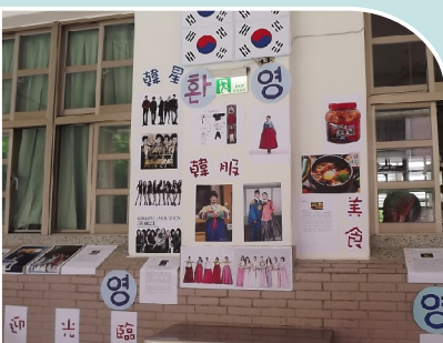
810穿著韓服四處拉票，果然殺很大，獲得第一高票