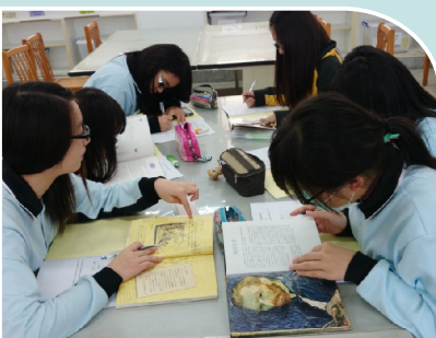
702翻閱館藏美術圖鑑，並完成學習單