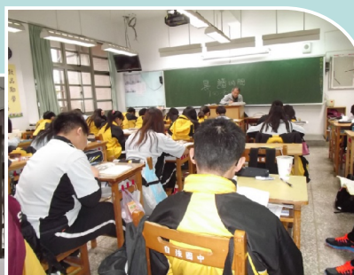
703師生共讀 一雙溫暖的手：德雷莎修女