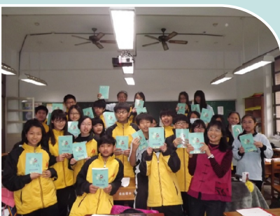
702班級讀書會－共讀貓頭鷹男孩