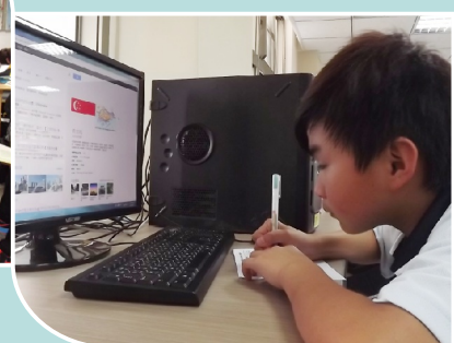
利用圖書館的電腦查沙烏地阿拉伯，迅速又確實