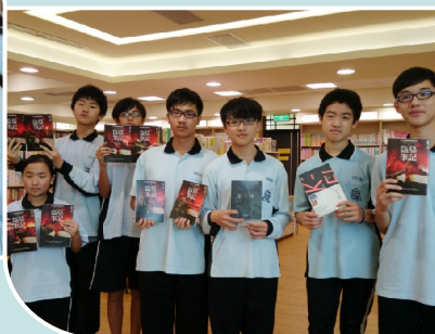
自強少年書店之旅～ 到政大書城選購圖書