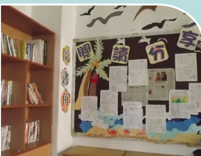
808班級書庫及閱讀專欄

(b)在一樓穿堂設置「好書交換～漂書櫃」，將全校師生捐贈的書刊，置於其間，自由取