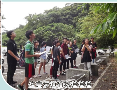
佐倉步道植物追追追