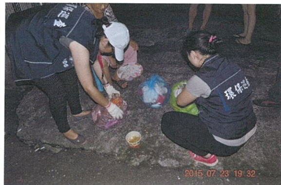
稽查人員檢視民眾垃圾