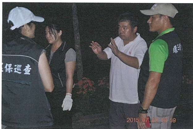
隊長協助說明破袋稽查情形及勸導業者需執行垃圾分三類