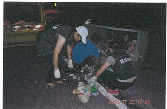
子車內完全未分類