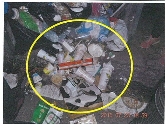
上圖為稽查人員撿拾出來之資源垃圾，其中夾雜大量一次用飲料杯、廢塑膠容器、廢紙容器、廢鐵鋁罐等。