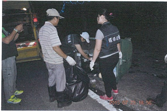
放置紅葉溫泉旅社之子車