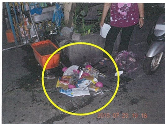
垃圾中混有大量回收物