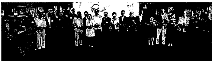
評判及嘉賓為香港國際學生視覺藝術比賽暨展覽(2014)