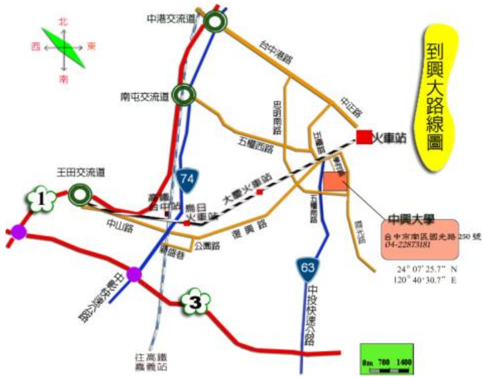
中興大學交通路線圖 1