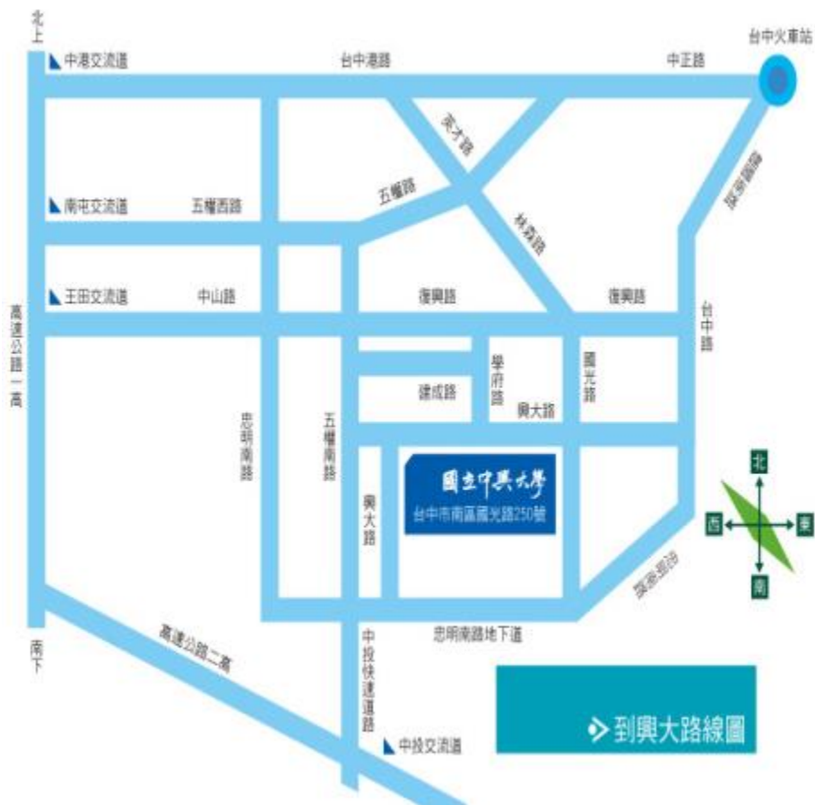
中興大學交通路線圖 2