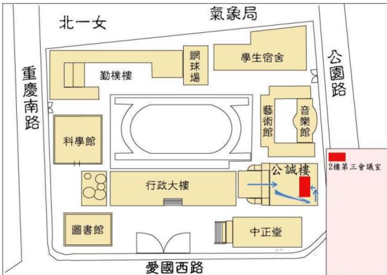
臺北市立大學校園示意圖