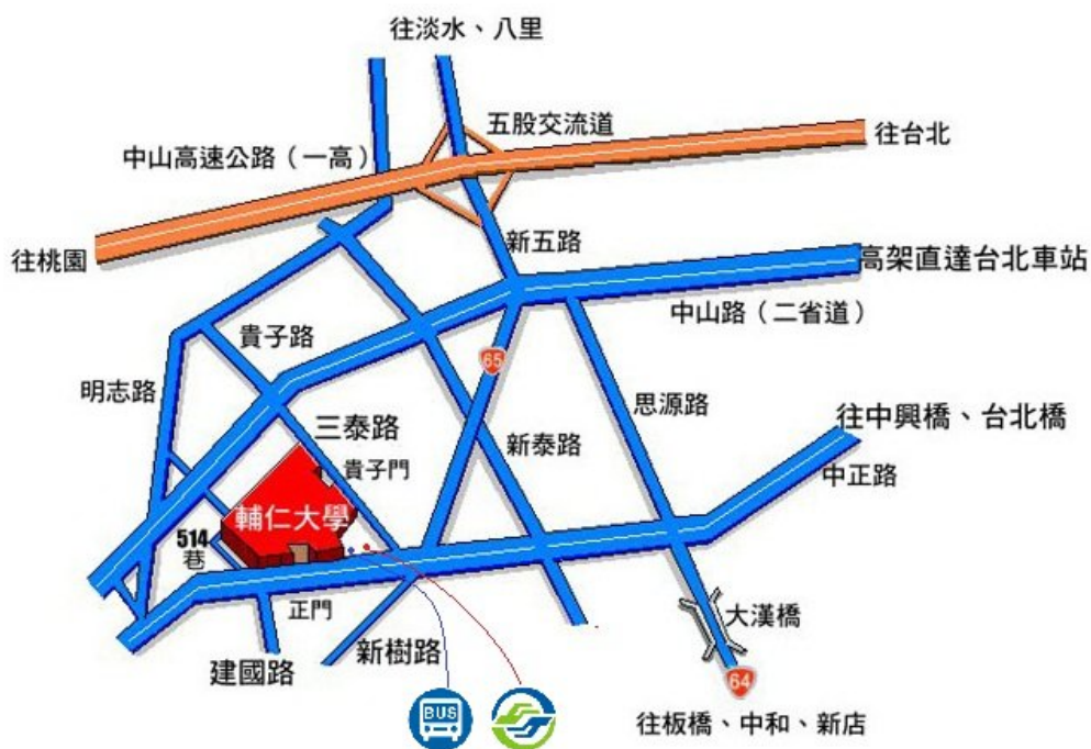
輔仁大學交通位置圖