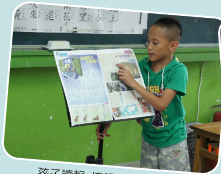
孩子讀報 摘錄重點 並分享