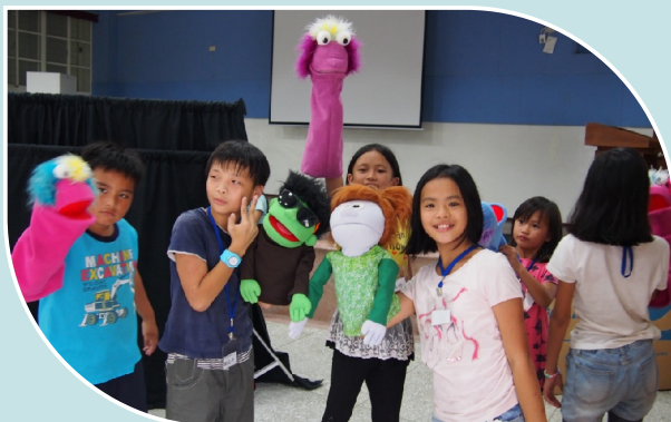
啄木鳥-手偶戲劇營

(2)走進生態大書裡：每日晨間戶外運動、打掃，享受陽光、尋找驚奇~在水黃皮樹下被風吹落