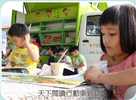
天下閱讀行動車到訪

而非來自行政體系的壓力。因此不會因行政人事更迭而改變，這樣的用心已形成學校推動之風氣，教師積極參與校外閱讀活動不斷活化閱讀能量與風貌。