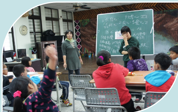
啄木鳥協會每週三的品格故事