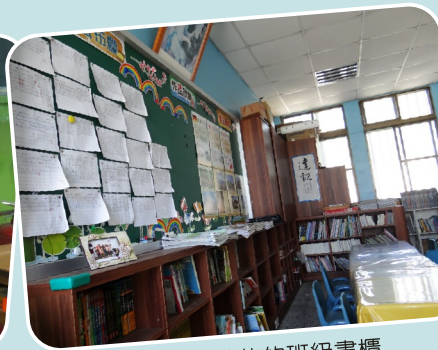
飛碟電台募款的班級書櫃