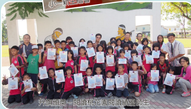
升旗頒獎—閱讀桃花源閱讀績優師生