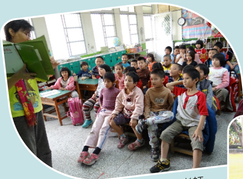
早療協會乃馨老師故事時間

大量引進外埠資源，文字夠感性，活動多元，可惜閱讀活動缺乏整體感。活動橫向聯繫較為不足。