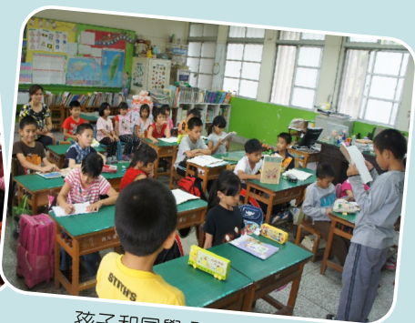
孩子和同學分享生活札記