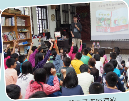
誠品悅讀趣－與信子作家有約