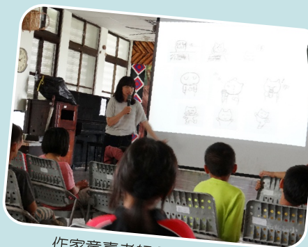
作家董嘉老師分享繪本製作