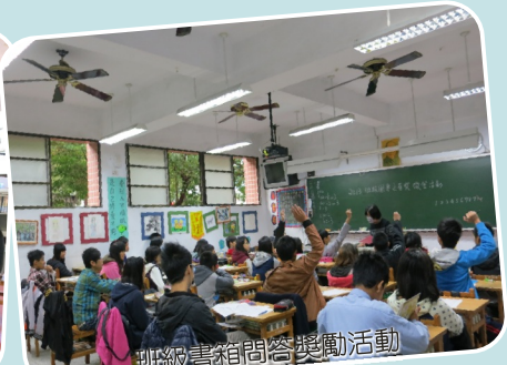
班級書箱問答獎勵活動