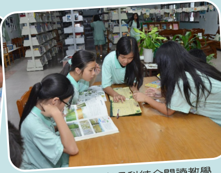
資訊利用素養與各科結合閱讀教學 生物課