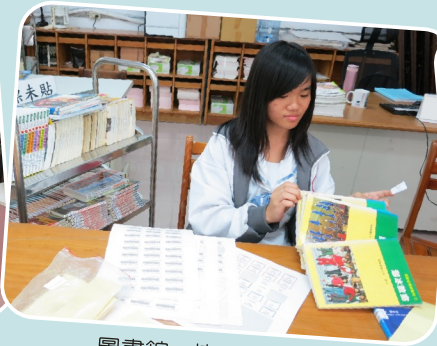
圖書館－協助書籍編目