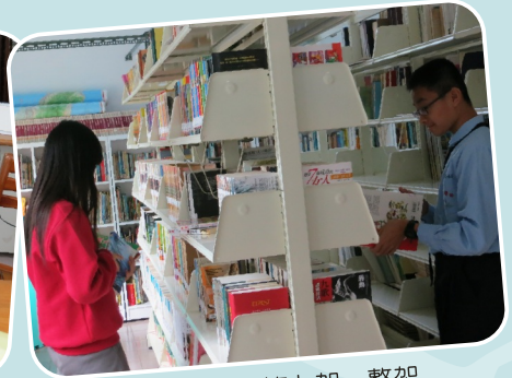
圖書館－書籍上架、整架