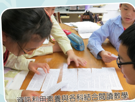
資訊利用素養與各科結合閱讀教學 國文課