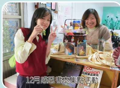
12月感恩書本集點活動