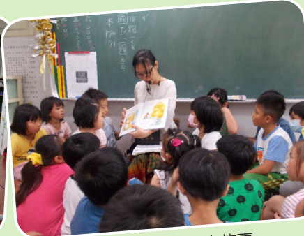
家長志工導讀繪本故事