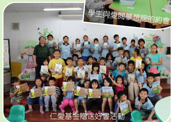
仁愛基金贈送好書活動