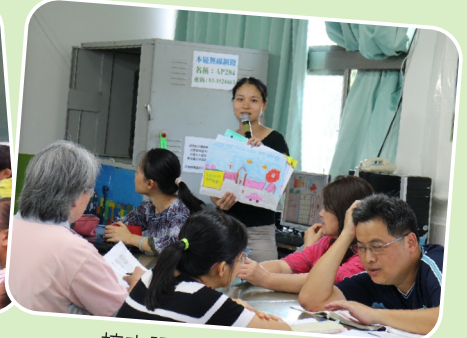
校本課程閱讀實施分享