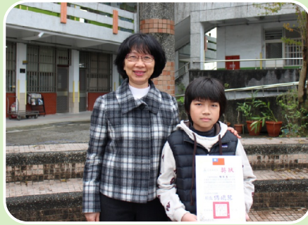
102學年度縣英語閱讀競賽第一名