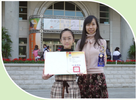
102學年度全國語文競賽朗讀全國第四