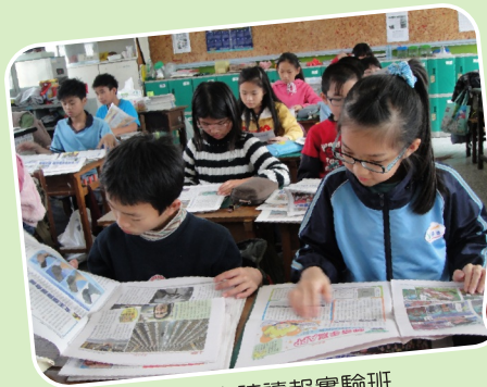
班級申請讀報實驗班