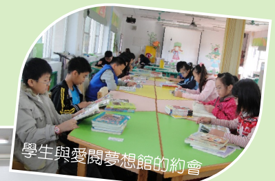
學生與愛閱夢想館的約會

閱讀教育計畫架構清晰、明確，從理念到規劃，建立具體可行全校閱讀策略，執行成果豐碩。建立圖書館運作及閱讀校本模式，結合課程與資源，營造閱讀環境氣氛，愛閱夢想圖書館很有創意。