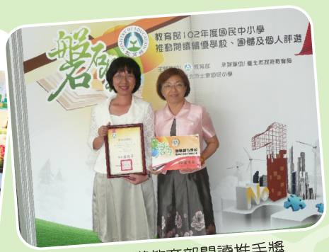
梅校長榮獲教育部閱讀推手獎