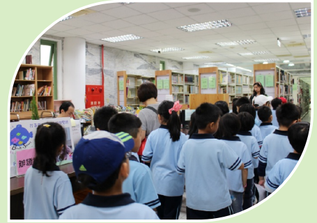
小朋友認識縣立公共圖書館