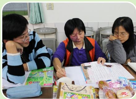
年級老師以共備方式做閱讀教學設計