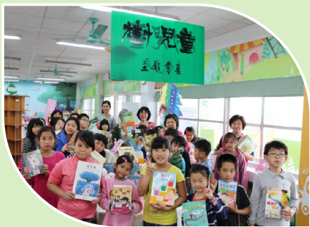
主題書展：樹與兒童