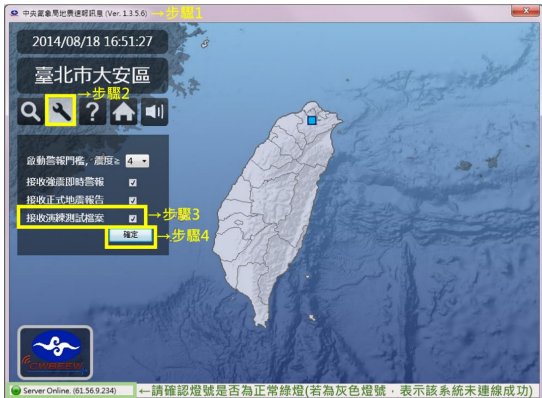
實施步驟軟體操作圖