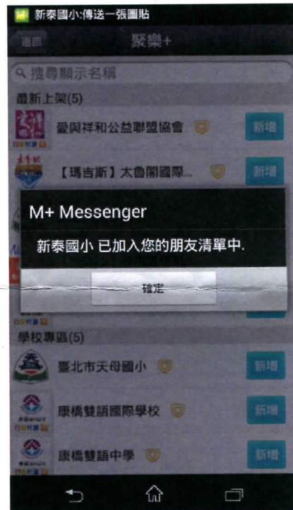
圖 2：成功加入官方帳號畫面