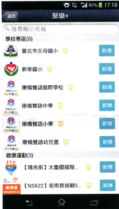
圖 1：校園官方帳號列表