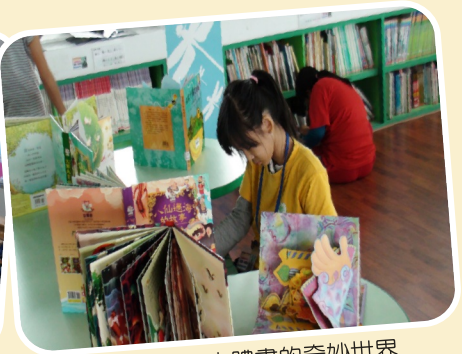
主題書展~立體書的奇妙世界