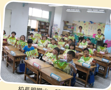
校長親贈小一新生閱讀書袋