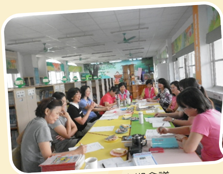
圖書志工定期會議