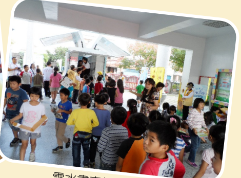
雲水書車行動圖書館

高年級的閱讀理解策略教學架構，同時整合各年段應學習的閱讀階段能力，學校團隊形成共識，本校閱讀教學架構將更趨完整。