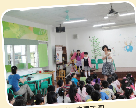
梅校長的故事花園