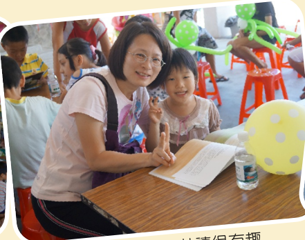
誠品書車親子共讀很有趣