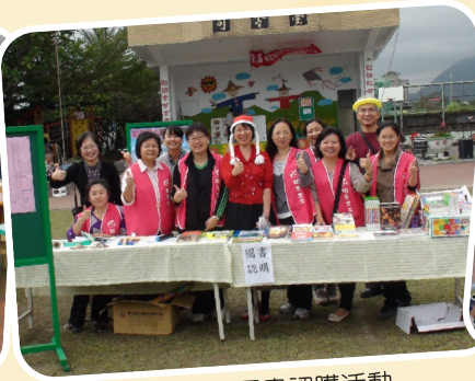
寒冬送暖圖書認購活動