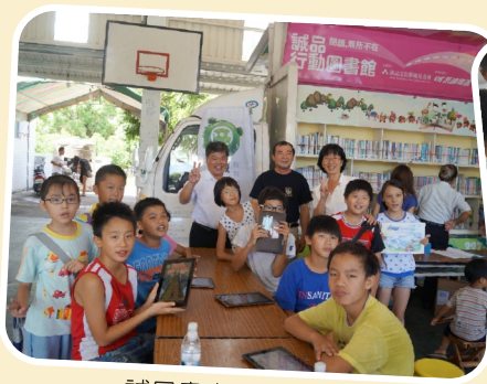
誠品書車行動圖書館