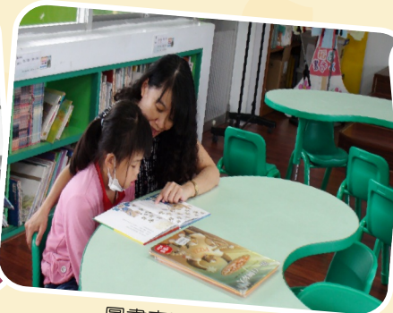
圖書志工陪伴閱讀