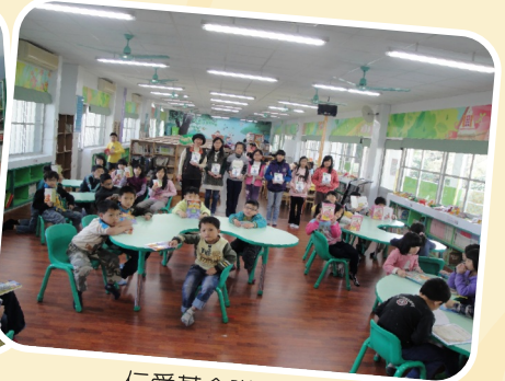
仁愛基金贈書活動