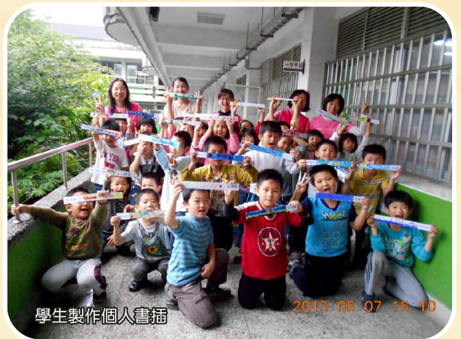
學生製作個人書插