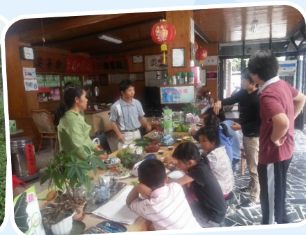
本土使命式拜訪茶行