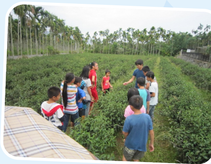
暑期閱讀營參觀茶園