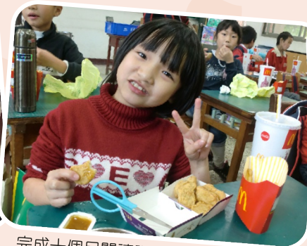
完成十個月閱讀認證兌換麥當勞套餐