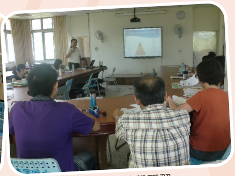
閱讀理解教學研習