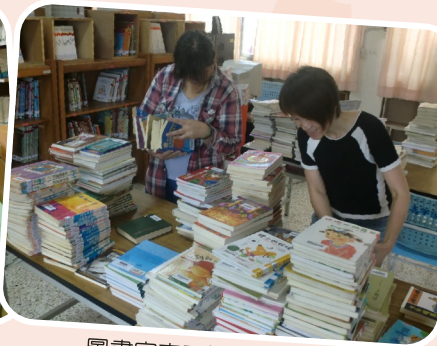
圖書室志工協助圖書排架