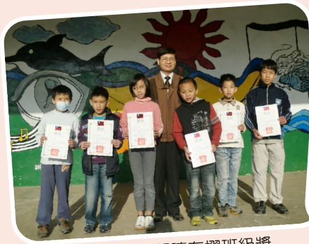
頒發志哈克閱讀存摺班級獎