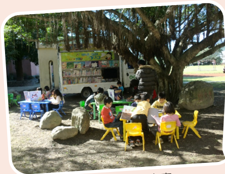
一粒麥子行動書車

教導主任擬定閱讀計畫，負責E化系統開發、閱讀網站建置、線上榮譽制度和閱讀檢核機制的程