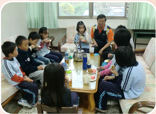
完成五個月閱讀記錄兌換校長室下午茶