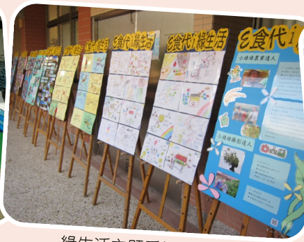
綠生活主題看板成果展示