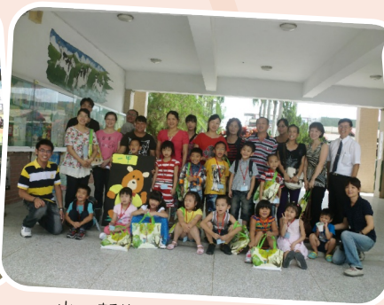
小一新生閱讀起步走贈書活動