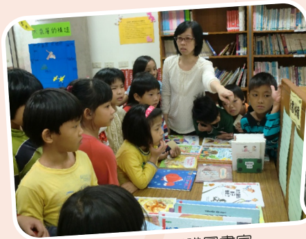
圖資教育－認識圖書室