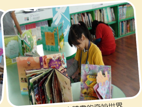
主題書展~立體書的奇妙世界