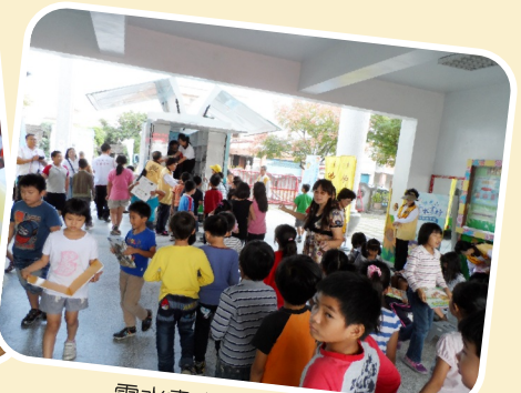
雲水書車行動圖書館

本校的總體課程以「稻香書香，鳥語花香」為主軸，102年度班群閱讀會議將研擬專屬本校低中高年級的閱讀理解策略教學架構，同時整合各年段應學習的閱讀階段能力，學校團隊形成共識，本校閱讀教學架構將更趨完整。