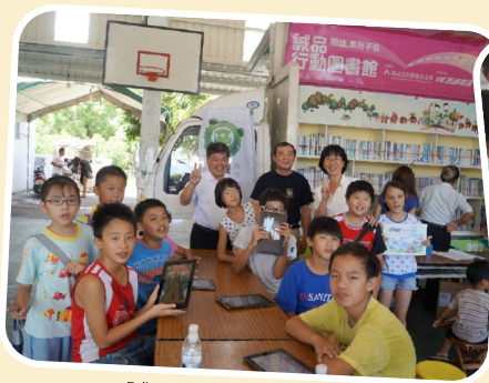
誠品書車行動圖書館