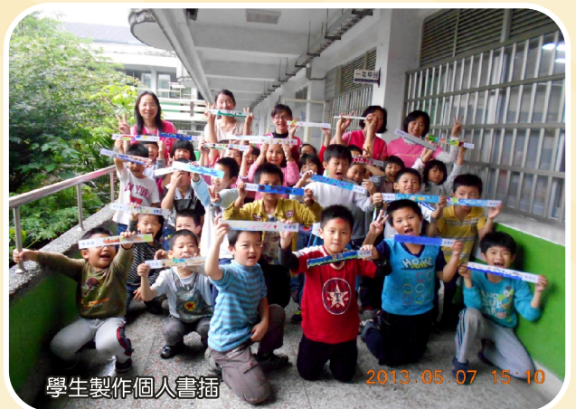
學生製作個人書插