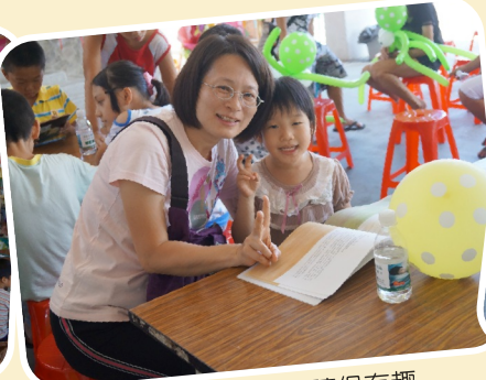
誠品書車親子共讀很有趣