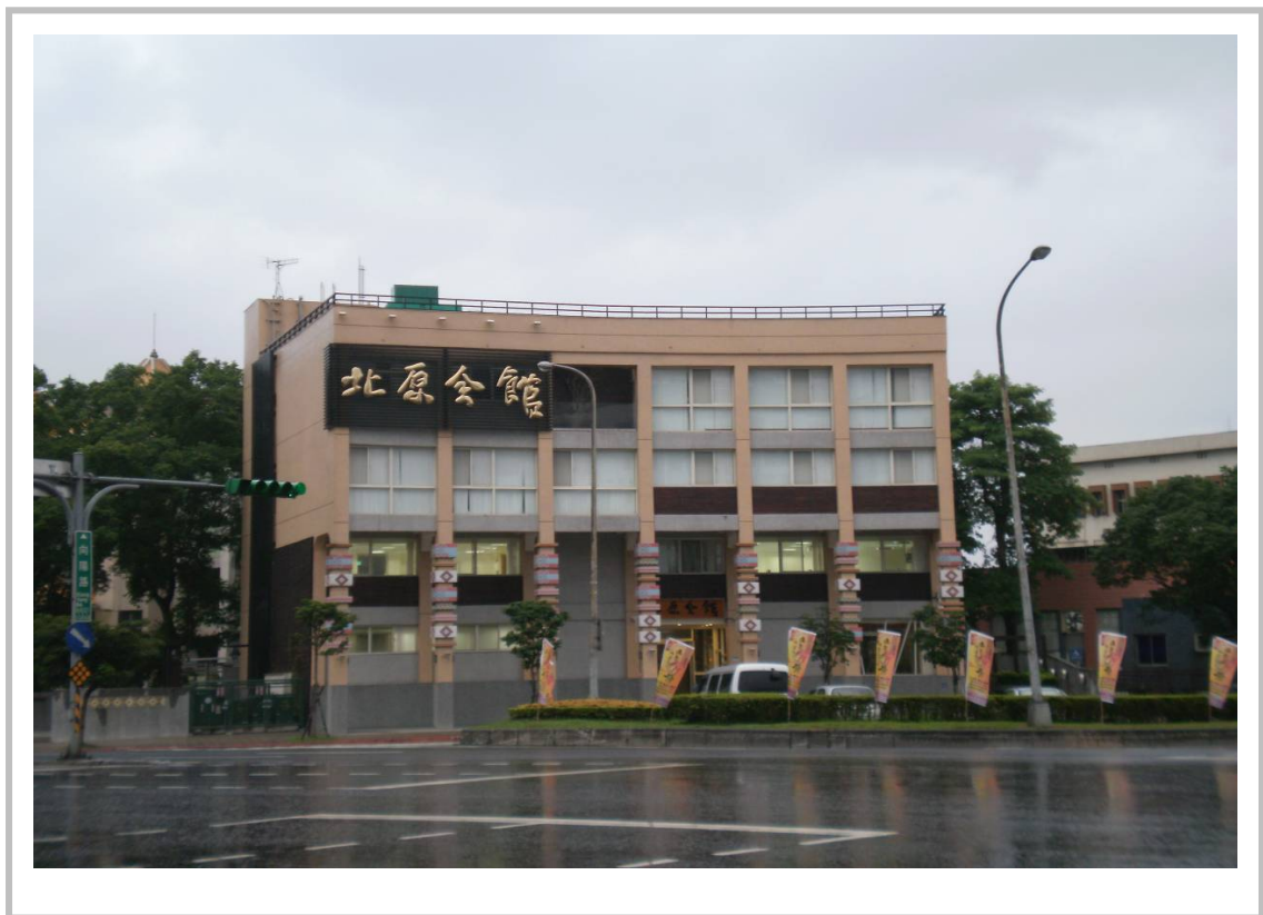
北原會館正面照片