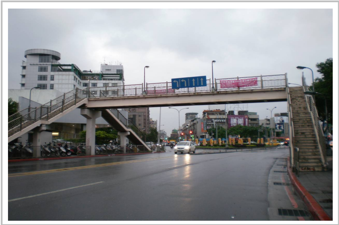
玉成國小人行陸橋照片