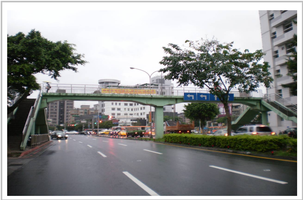
南港國中人行陸橋照片