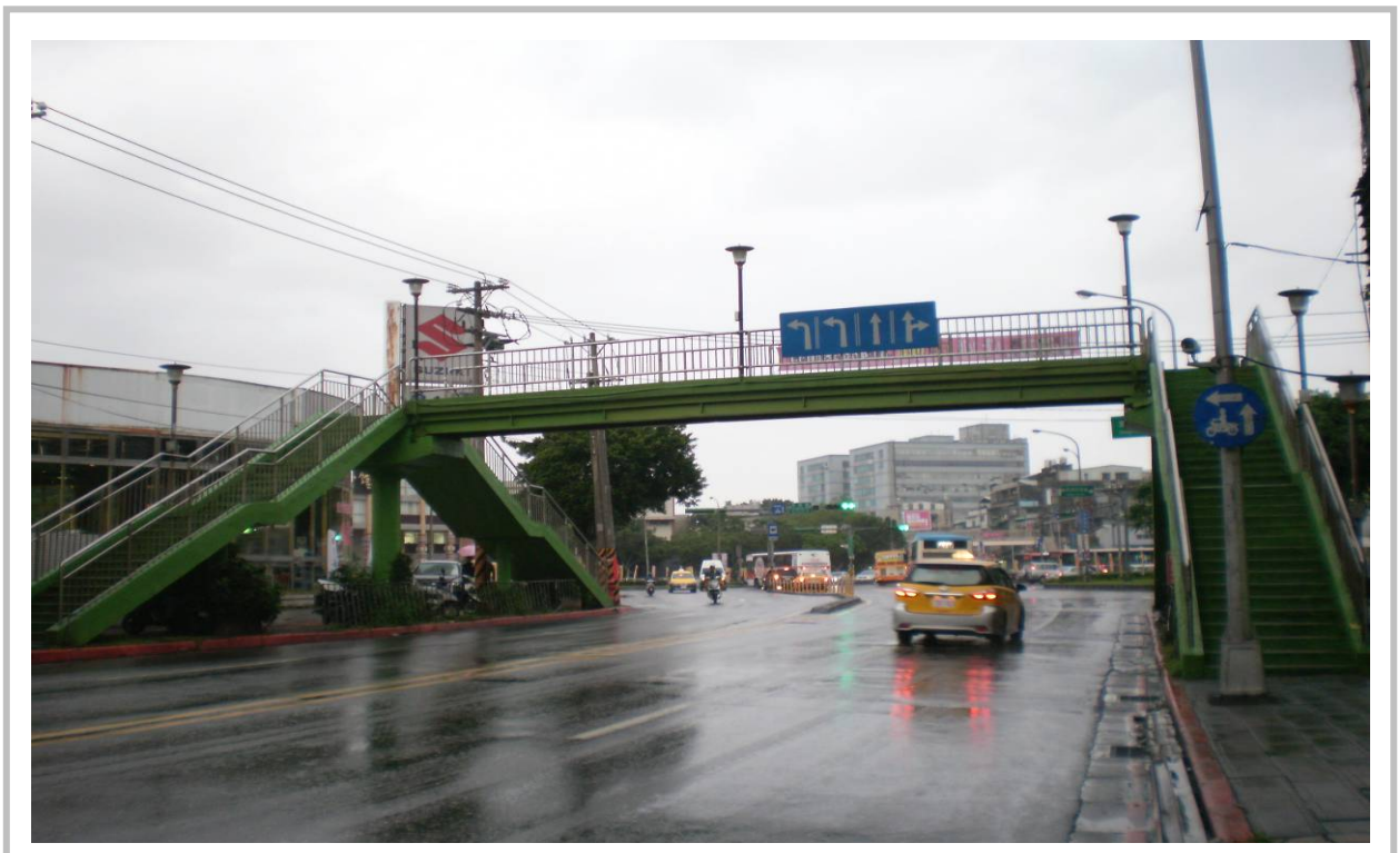
南港向陽人行陸橋照片