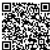
線上報名 小攝影師報名平台