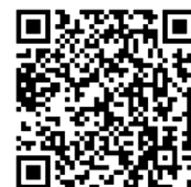
宜花 DOC FB 粉絲專頁