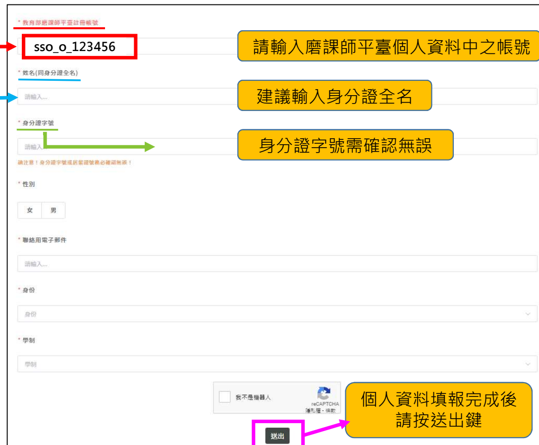
▲ 教育部國教署本土語文資料庫系統