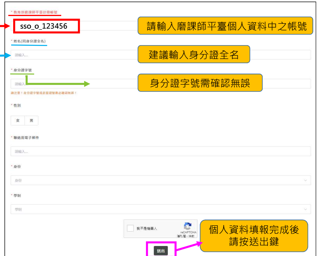
▲ 教育部磨課師平臺