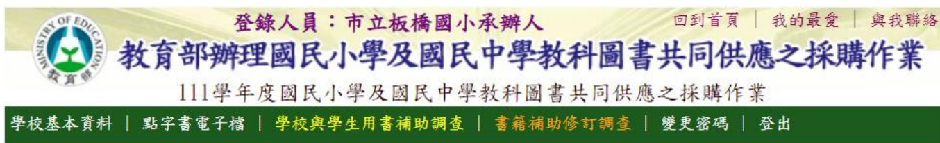
《學校承辦人基本資料填寫》