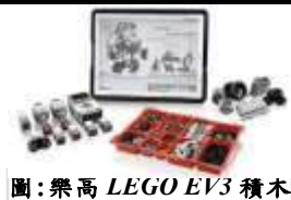
圖：樂高 LEGO EV3 積木