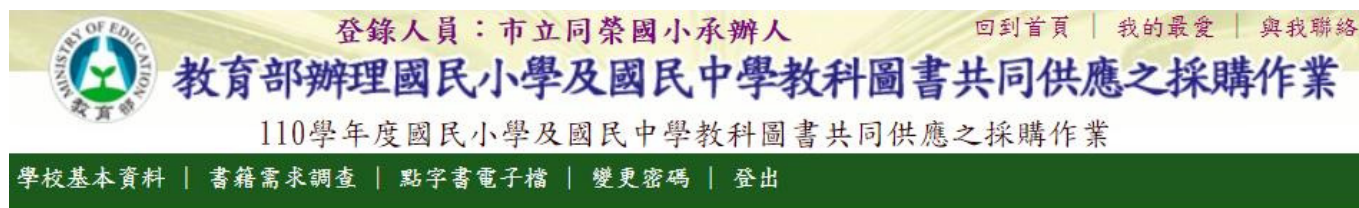
《學校承辦人基本資料填寫》