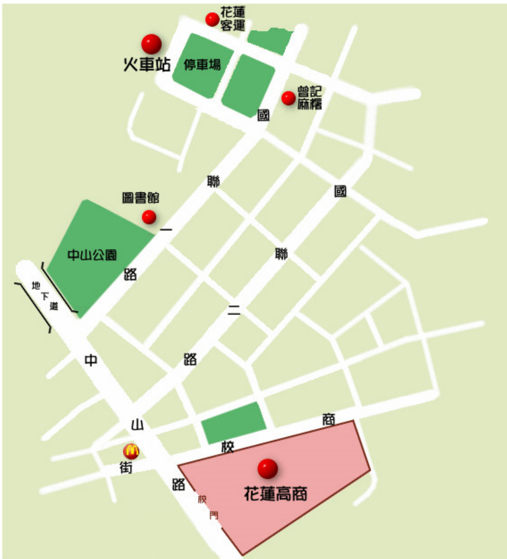
附圖一 承辦學校位置圖