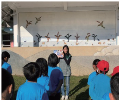
升旗時間，宣導閱讀桃花源手冊，鼓勵學生紀錄閱讀之書。