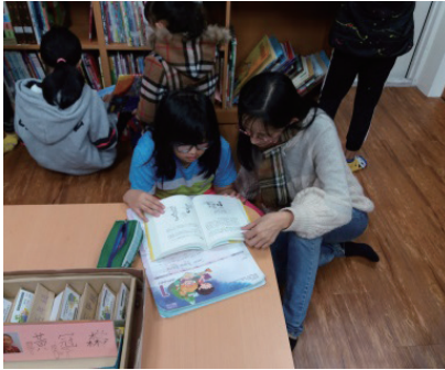
晨讀時間師生在圖書室共讀