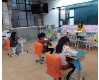
校長入班 ~ 身教式寧靜閱讀