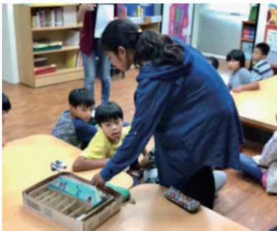
高年級示範書插使用方式