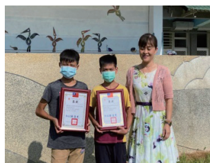
我們的成果 ~ 鄉競賽獲佳績、縣內線上讀經獲高年級優等、學習扶助獲學習潛力獎至教育部受獎。