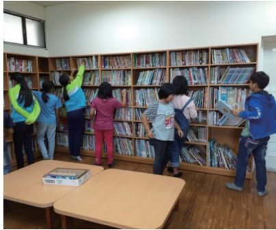
晨讀時間學生使用圖書館情形