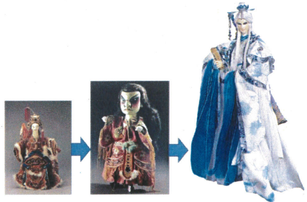
①傳統⇒金光⇒霹靂 布袋戲偶

(一)布袋戲的服飾小巧美觀學問大 布袋戲綜合了戲劇、文學、美術、音樂、舞蹈等藝術美，穿在戲偶身上的服裝不只美觀，還用來區分角色的男女、文武、身份、地位及性格。傳統戲服適合手掌操演大小，沒有腰身，雜揉唐宋元明清朝的樣式，精巧的刺繡，吉祥的圖案，文官穿蟒服，武將穿戰甲，多種服飾以適合不同情況穿著，布袋戲服飾的學問可真不少。