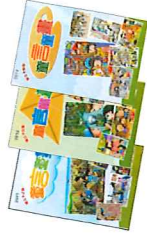
「溫馨家園」童言童畫入圍作品集