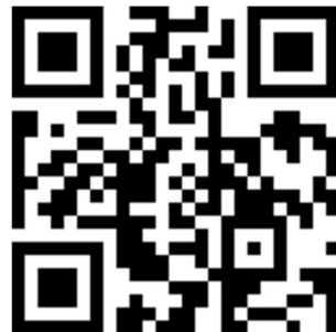
校舍專案計畫 FB 專頁