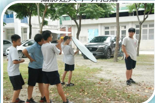
攝影達人 戶外拍攝