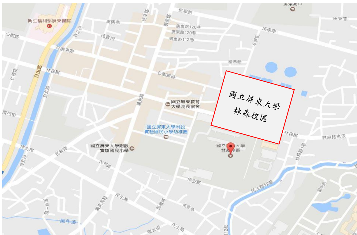
國立屏東大學林森校區平面配置圖