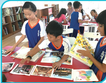
國語課延伸閱讀教學