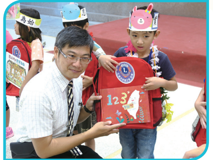
小一迎新贈書閱讀起步走