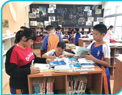
寵物當家專題書展