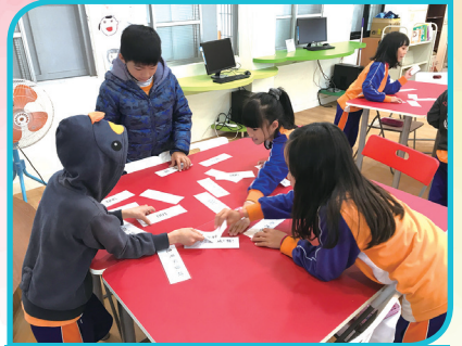
圖書館利用教育_中國圖書十大分類法