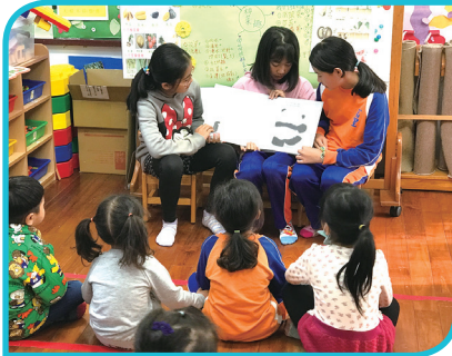
小志工幼兒園說故事