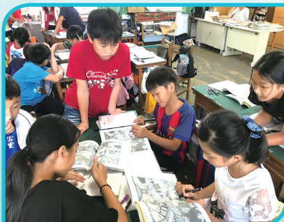
聽說讀寫有策略_說明文教學