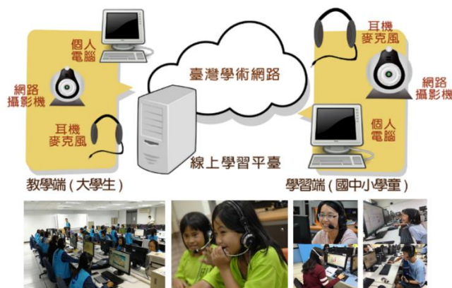
【圖 1 數位學伴計畫線上環境與設備架構】

以大學學伴制為概念，招募、培植大學生擔任偏遠地區國民中小學學童之學伴，藉由視訊設備與線上學習平臺，讓教學端(大學生)與學習端(國民中小學學童)以定時、定點、集體(集中於學校電腦教室)方式，每週 2 次(每次 2 堂課，每堂課 45 分鐘)，進行一對一線上即時陪伴與學習，提供資訊應用及學習諮詢。