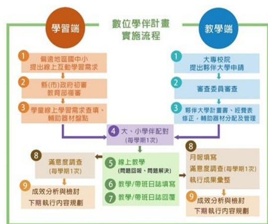
【圖 3 數位學伴計畫實施流程】