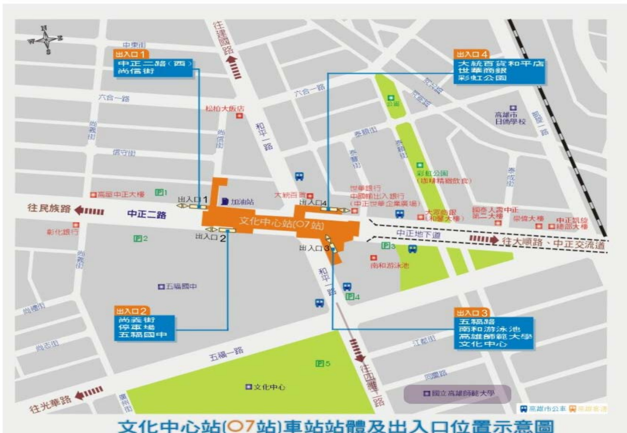
文化中心站(O7站)車站站體及出入口位置示意圖