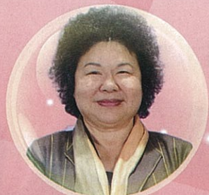
陳菊 / 市長 / 高雄市政府