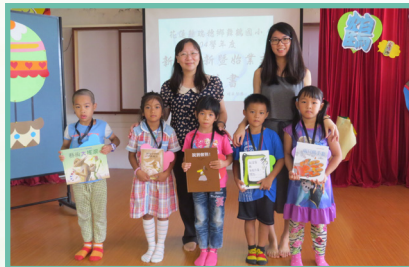
校長親自贈送閱讀禮給新生