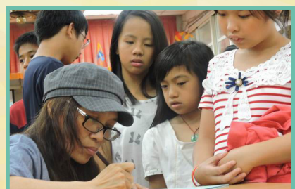
一頁書創作作品請作家簽名 大家都像小粉絲