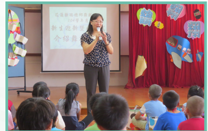
校長向全校學生及家長宣導閱讀的重要