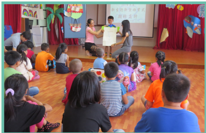
利用贈書進行親子共讀