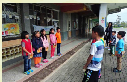
每週三輪流不同年段上台進行讀經背誦發表，增加學生上台表現的機會。