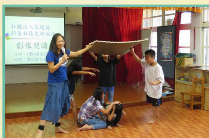
新象影像閱讀營 - 讓學生學習從影片中讀出 作者想表達的意念，再將影片故事演出來。