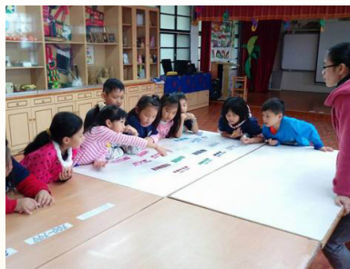
經由小組競賽遊戲 讓學生認識十大分類和排架