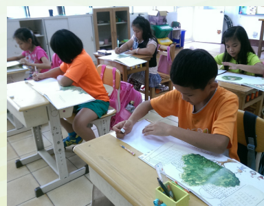
學生將本書中最愛的一個畫面跟一句話完成。