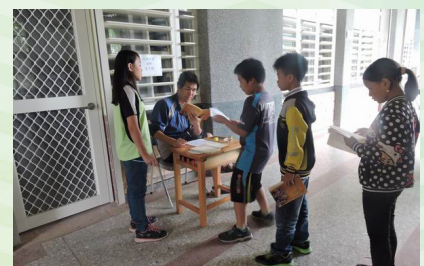
期末經典闖關活動