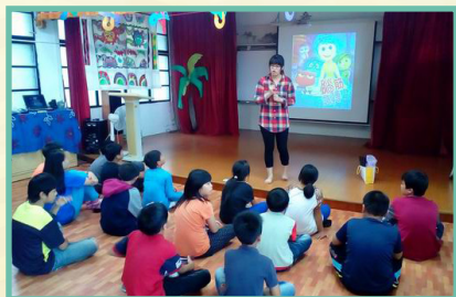
新象故事媽媽說故事