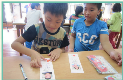
閱讀激勵書籤製作