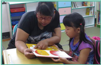
利用贈書進行親子共讀