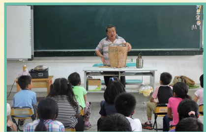
社區故事叔叔阿姨說在地故事