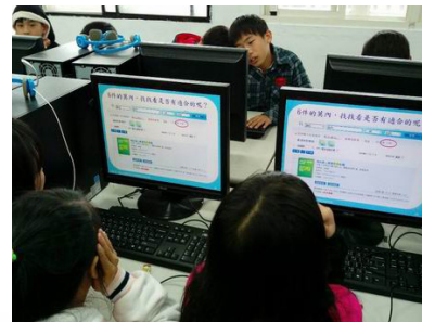
能綜合運用校內外圖書館系統功能