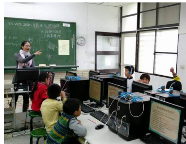
會使用網路搜尋引擎