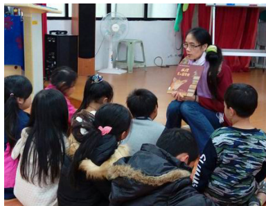
從「狐狸愛上圖書館」繪本 導入學習建立及遵守圖書館的各項規則