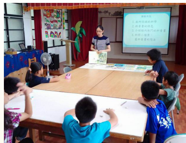
學習如何閱讀各類圖書 以科普書為例