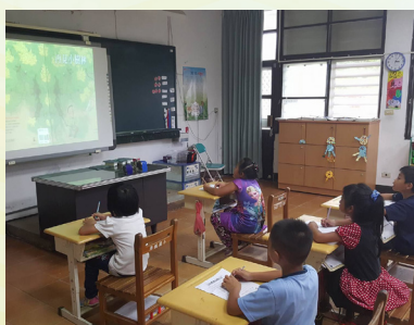
學生透過繪本封面、主題，猜一猜接下來會發生什麼故事？