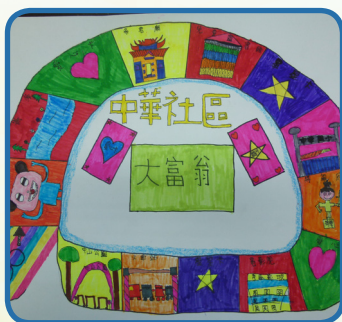
5年級小朋友閱讀鄉土書籍設計 社區桌遊遊戲