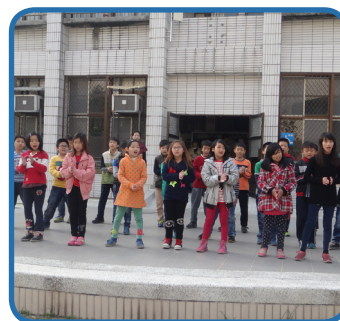
利用升旗時間進行「讀經教育」成果分享