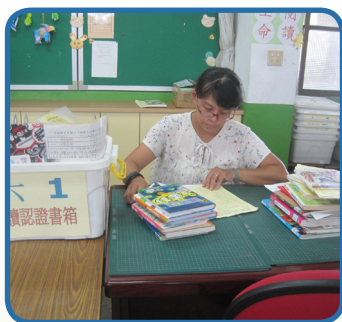
圖書志工協助圖書認證