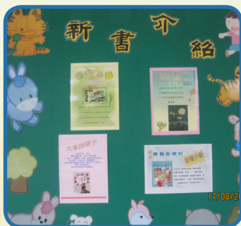
張貼新書介紹卡，為小朋友介紹新書