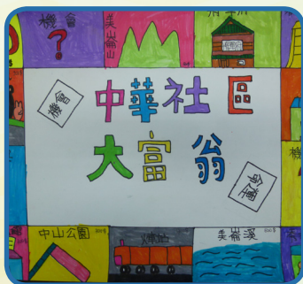
5年級小朋友閱讀鄉土書籍設計 社區桌遊遊戲