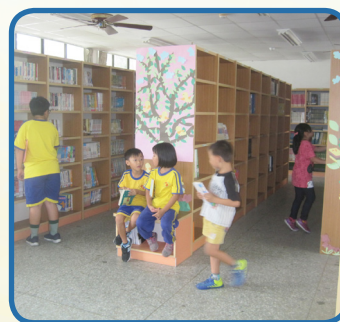
寬敞舒適的閱讀空間