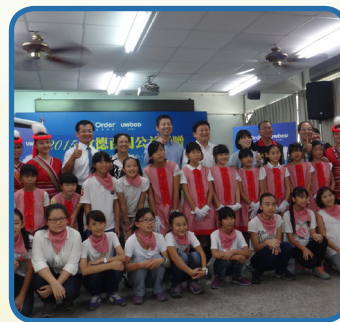
歐德集團捐贈幸福圖書室