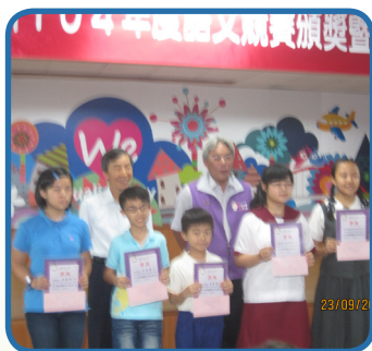
104 學年度花蓮市公所語文競賽 頒獎典禮