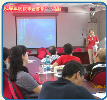
教師讀書會 ---- 全校教師閱讀教學分享