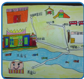
3年級小朋友閱讀鄉土書籍設計 社區藏寶圖