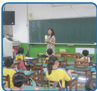
低年級老師於晨讀十分鐘為孩子朗讀故事