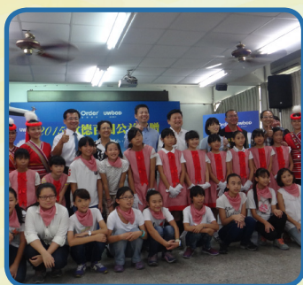
歐德集團捐贈幸福圖書室