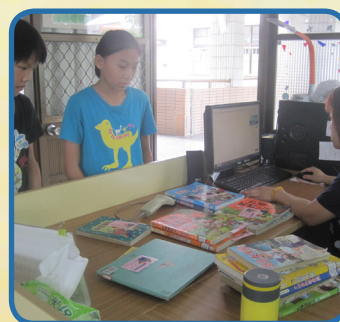
圖書室自動化服務