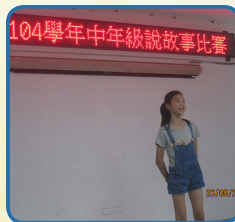
中年級說故事比賽