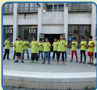
利用升旗時間進行「讀經教育」 成果分享