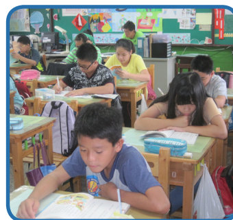
在導師陪伴下，安靜享受晨讀時光