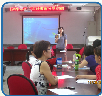
教師讀書會 ---- 全校教師閱讀教學分享