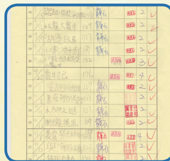
學生將閱讀過的書籍記錄在「閱讀認證記錄卡」，並請家長簽名