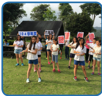
六年級「閱讀劇場」演書活動