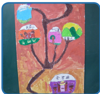
3年級小朋友閱讀鄉土書籍設計 社區藏寶圖