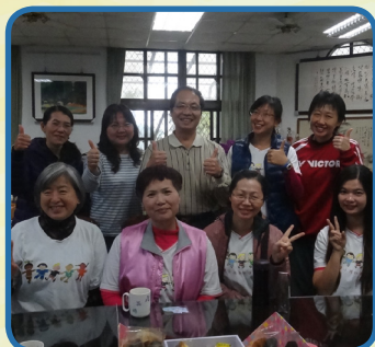
校長和主任定期和彩虹媽媽聚會，感謝辛苦的付出