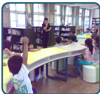
一年級圖書館利用