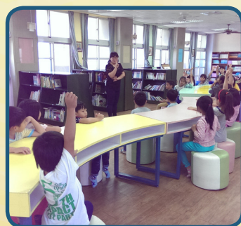
一年級圖書館利用