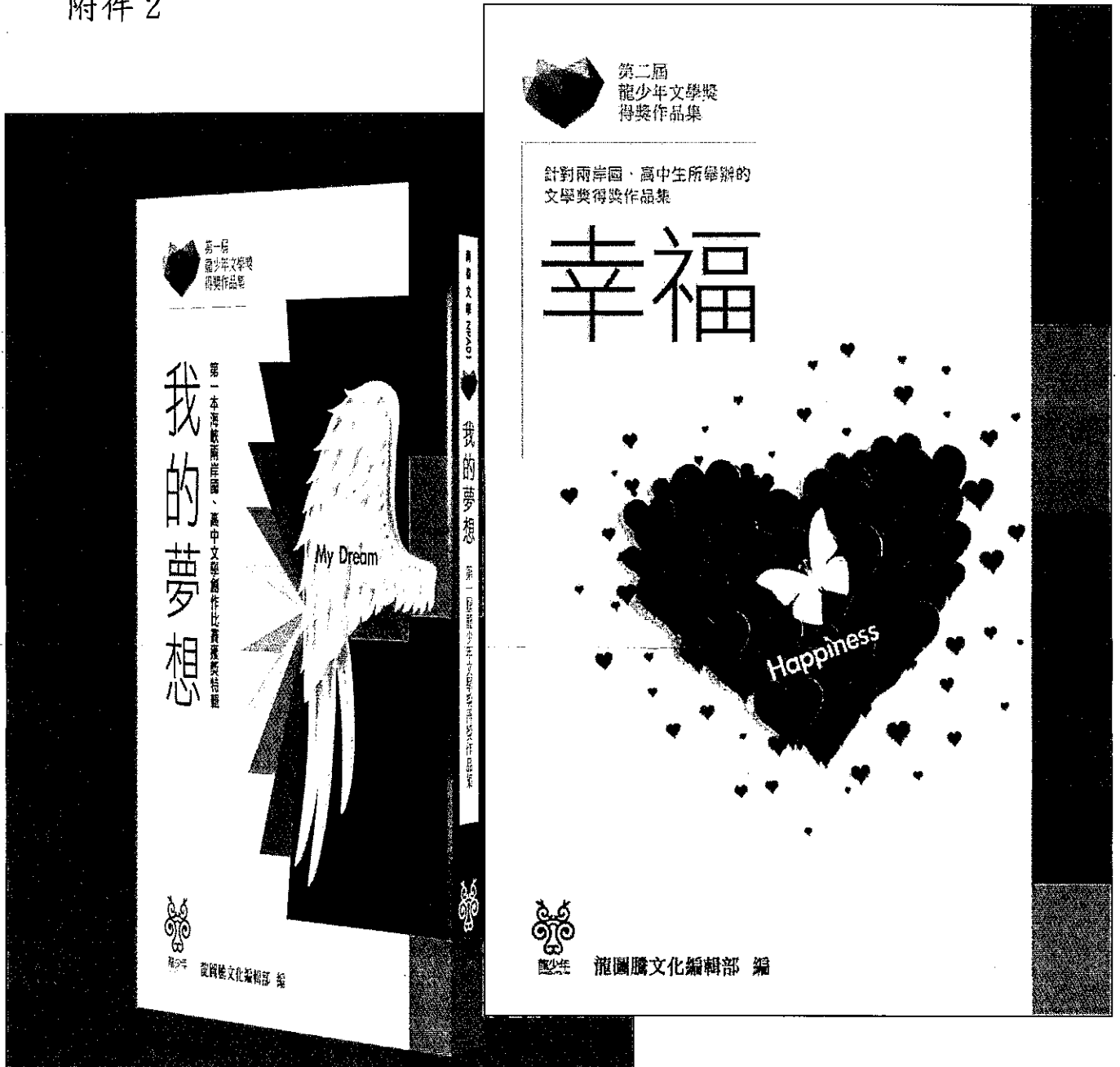
圖說：前兩屆龍少年文學獎合輯專書