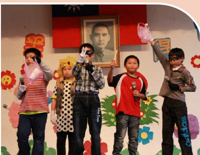
學生於歲末成果發表會表演話劇

「雲水書坊」經由滿載圖書的行動書車如行雲流水般開往本校方便學生看書、借書，以戶外閱讀方式，破除圖書館建築的藩籬，主動積極貼