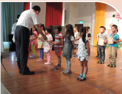
校長親自贈與閱讀書籍