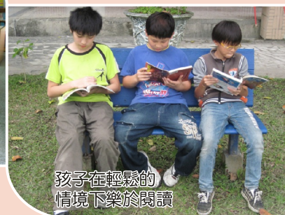
孩子在輕鬆的情境下樂於閱讀